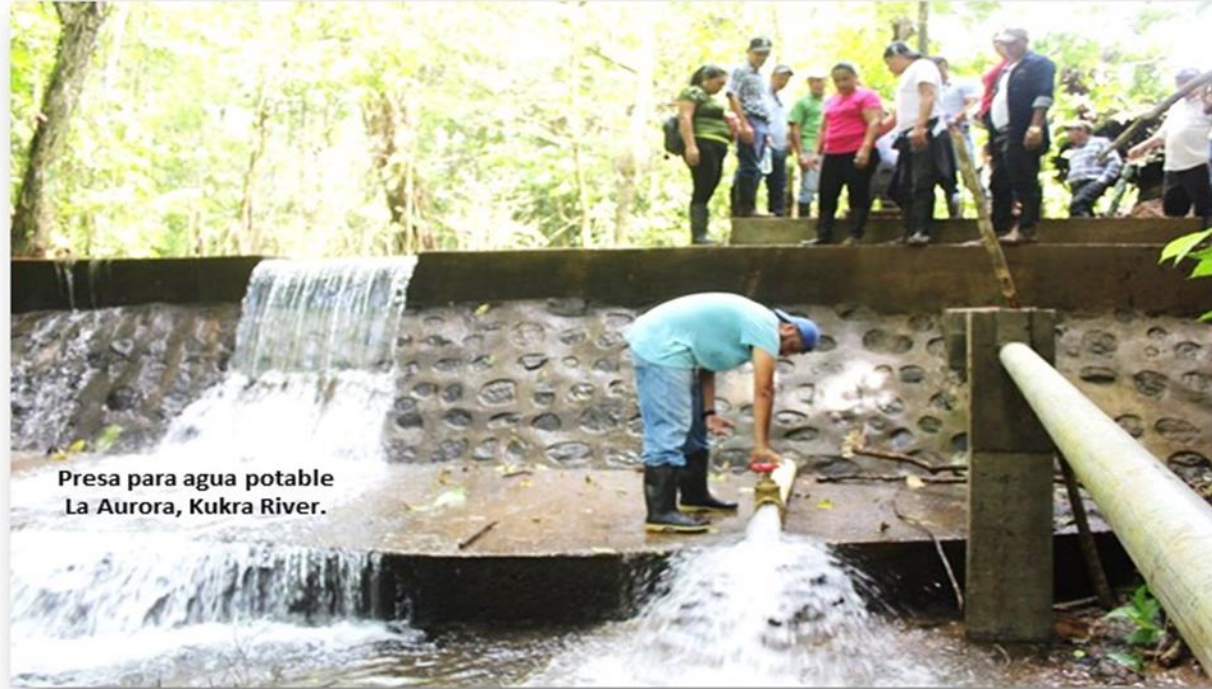
Presa para agua potable La Aurora, Kukra River.

Edición No. JULIO 15 CRISTIANA, SOCIALISTA Y SOLIDARIA.