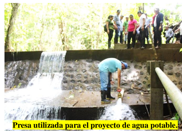
Presa utilizada para el proyecto de agua potable.