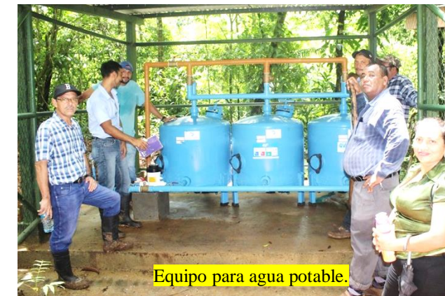
Equipo para agua potable.

Bajo el modelo de responsabilidad compartida la Alcaldía del Poder Ciudadano del Municipio de Bluefields, Gobierno Regional y el Fondo de Intervención Social de Emergencia (FISE) invierten más de 13 millones de córdobas en la ejecución del proyecto que garantizará agua potable de calidad a 294 familias, equivalente a 1764 personas que habitan en la Aurora Kukra River.