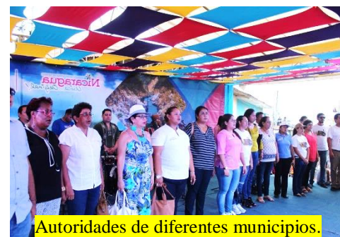
Autoridades de diferentes municipios.