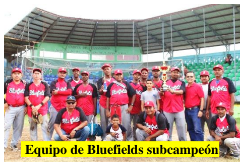
Equipo de Bluefields subcampeón

Después de tres días de intensos partidos el equipo representativo del municipio de La Cruz de Río Grande se coronó campeón al imponerse en la final 8 carreras a 4 ante el equipo del municipio de Bluefields.