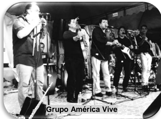
Grupo América Vive