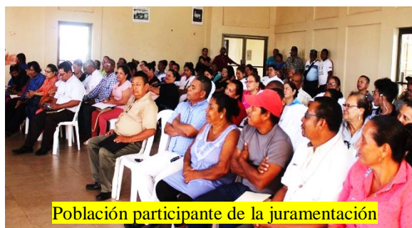
Población participante de la juramentación

La juramentación de la Comisión de Paz Justicia y Reconciliación, se desarrolló en la Casa de Cultura el viernes 26 de julio, quedando conformada por guías espirituales, educadores, líderes sociales, comunitarios, personalidades destacadas de Bluefields y líderes juveniles.