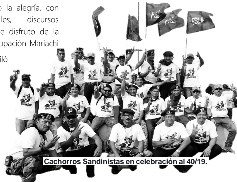
Cachorros Sandinistas en celebración al 40/19.