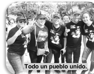
Todo un pueblo unido.

Siempre será 19 de julio y lo tenemos presente gracias a nuestro buen gobierno de unidad y reconciliación nacional de justicia y paz, que continua trabajando por la familia, la juventud, los adultos mayores, las mujeres, los niños, por la educación, la salud, por el campesino, la producción, por el desarrollo y por toda Nicaragua siempre libre. FSLN