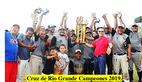
Cruz de Río Grande Campeones 2019.

El recorrido estuvo encabezado por autoridades municipales, regionales y deportivas, culminando en el Estadio Municipal Glorias Costeñas.