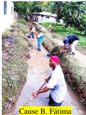
Cause B. Fátima

Esperamos que todos los barrios tomen el ejemplo de la disponibilidad de los habitantes de estos dos barrios en las jornadas de limpieza. #MiBluefieldsLimpio.