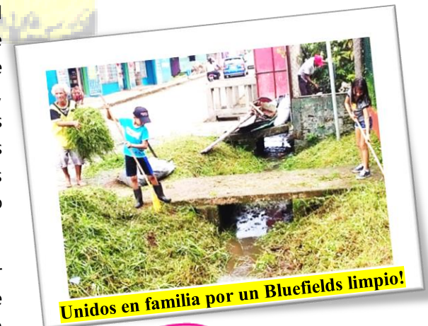
Unidos en familia por un Bluefields limpio!

Gracias a estas jornadas se ha logrado controlar la proliferación de mosquitos, la cantidad de personas afectadas por fiebres, los cauces están más limpios y la ciudad está mucho más saludable y bonita.