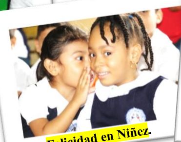
Felicidad en Niñez.