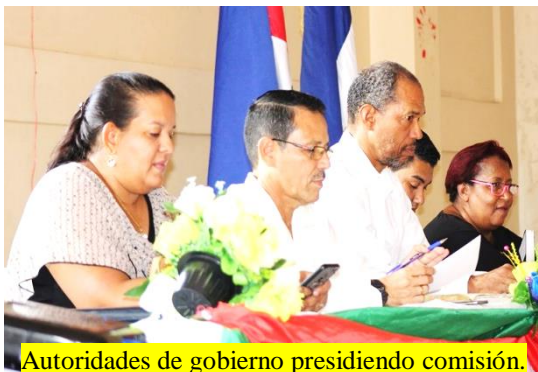
Autoridades de gobierno presidiendo comisión.

Hombres y mujeres fueron juramentados como miembros de la comisión de reconciliación, justicia y paz mediante un acto donde participaron pobladores del casco urbano y rural de Bluefields.