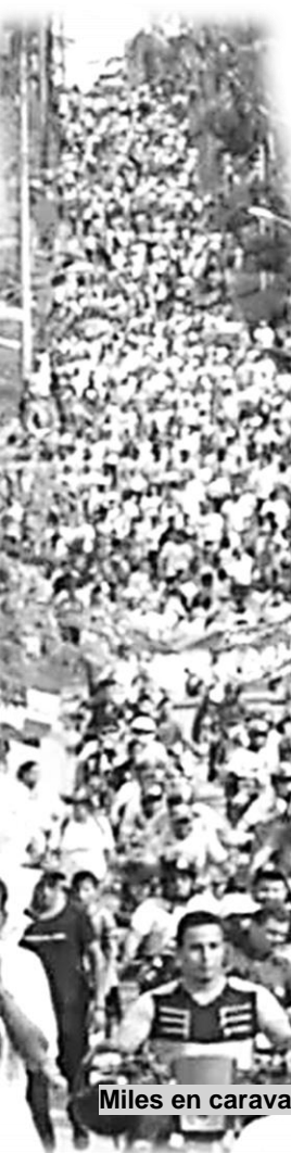
Miles en caravana 19/40 en Bluefields.