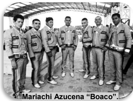
Mariachi Azucena "Boaco".

Bluefields disfrutó a más no poder las diferentes celebraciones del 40 aniversario del triunfo de la Revolución Popular Sandinista, en paz, unidad y progreso, fueron múltiples las expresiones culturales tanto locales como nacionales, en el parque, la plaza, las calles, los barrios, en toda la ciudad y sus comunidades. Se pudo disfrutar de las canciones de la agrupación musical América Vive en un concierto histórico que se desarrolló el sábado 13 de julio en la plaza del Parque Reyes.