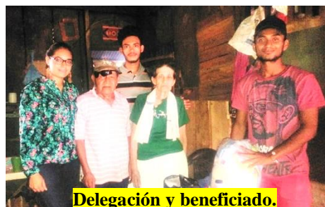
Delegación y beneficiado.

Los paquetes incluyen víveres básicos de uso diario de importancia para estos dignos hombre y mujeres adultos mayores,