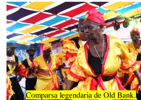
Comparsa legendaria de Old Bank.

En la actividad participaron 15 departamento y las dos regiones autónomas de la Costa Caribe Sur, Juigalpa, Chontales fue el anfitrión del cuarto festival que reunió a las familias nicaragüenses, evento que tubo lugar frente al parque central de ese municipio.