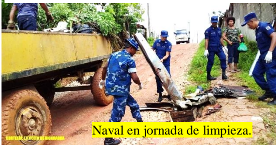
Naval en jornada de limpieza.

En saludo al 40 aniversario de constitución del Ejército de Nicaragua y en marco de apoyo a la población, 10 efectivos militares del Distrito Naval Caribe de la Fuerza Naval, en coordinación con autoridades Municipales, SILAIS y habitantes participaron en jornada de limpieza en el barrio Loma Fresca del municipio de Bluefields.