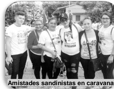
Amistades sandinistas en caravana.